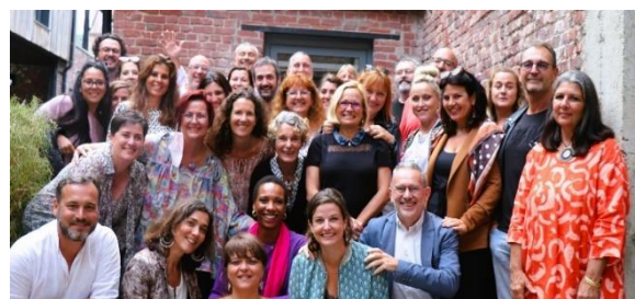
L'équipe Coaching Ways France Executive

Cette formation permettra l'obtention du certificat ACTP (Level 2) d'ICF permettant l'accès à la certification PCC (Professional Certified Coach).